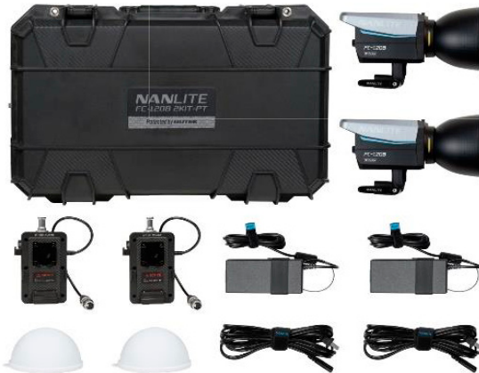
FC-120B 2KIT PT